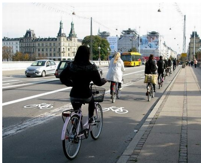
Obr. 2. Bicyklová doprava v zahraničí. Pri dlhodobej podpore zo strany mesta dosahuje až 20–40% podiel na celkovej doprave.