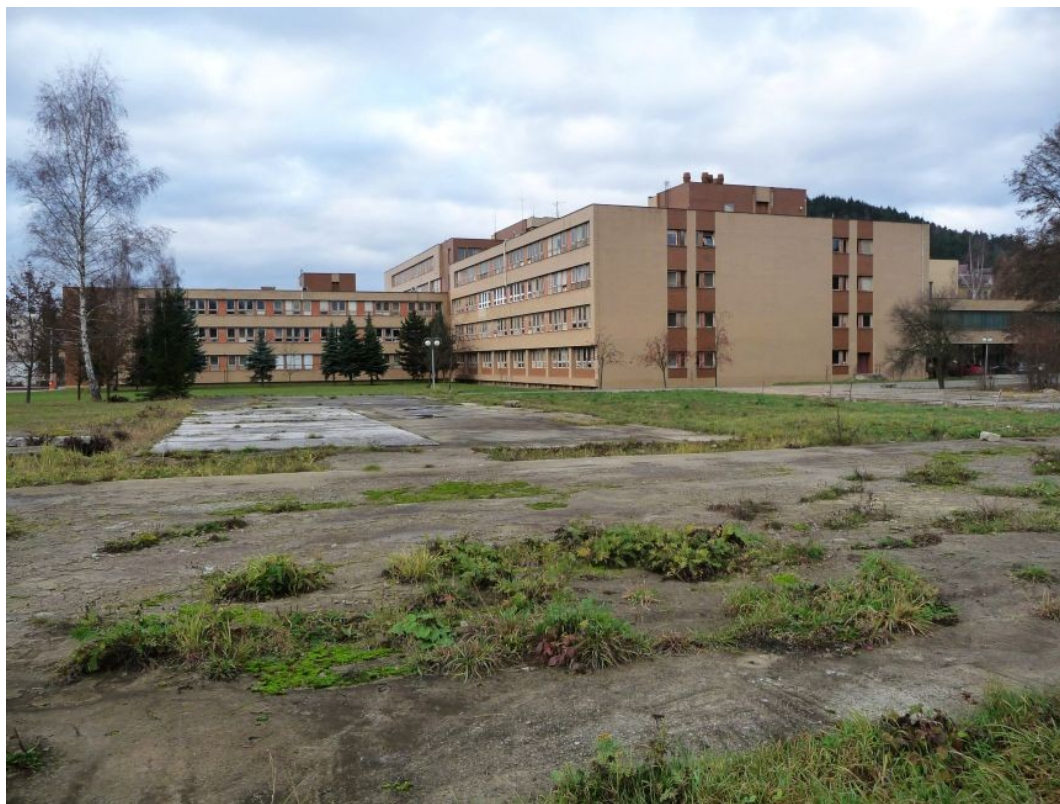
Obr. 3. V areáli nemocnice.